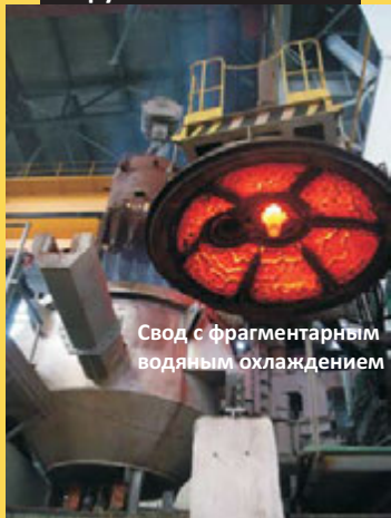
Свод с фрагментарным водяным охлаждением